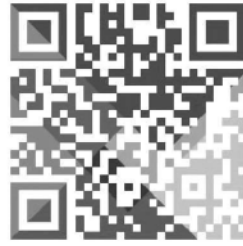
识别二维码查看原文